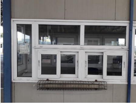
Спољашњи изглед постојећих кабина